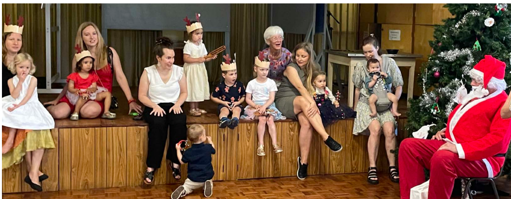
Bērnu dārza eglīte baznīcas zālē.